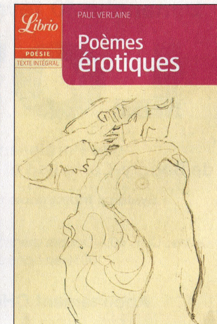
Paul Verlaine a choqué les sensibilités avec son recueil érotique.