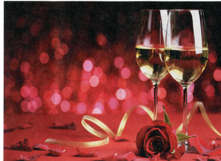
Le 14 février sera propice à vivre des moments à deux en partageant un moment privilégié.